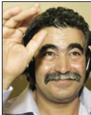
E lider laborista Amir Peretz.